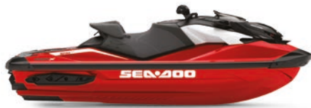
● NOUVEAU Rouge flamboyant Premium