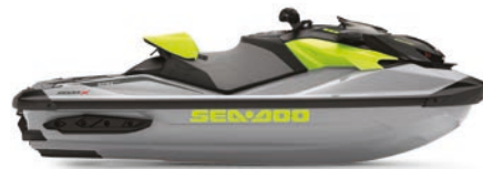
● NOUVEAU Métal glacé et Vert Manta