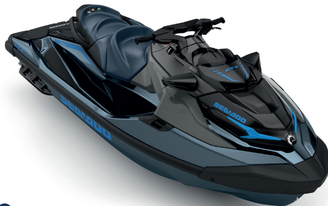
Blue Abyss / Gulfstream Blue