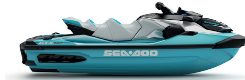
● Teal Metallic