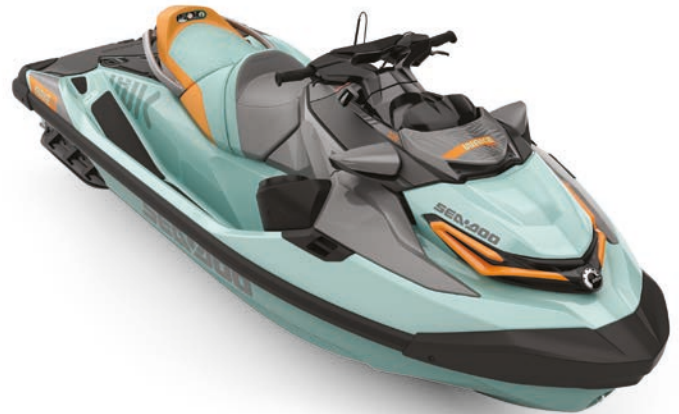
● Néo Menthe